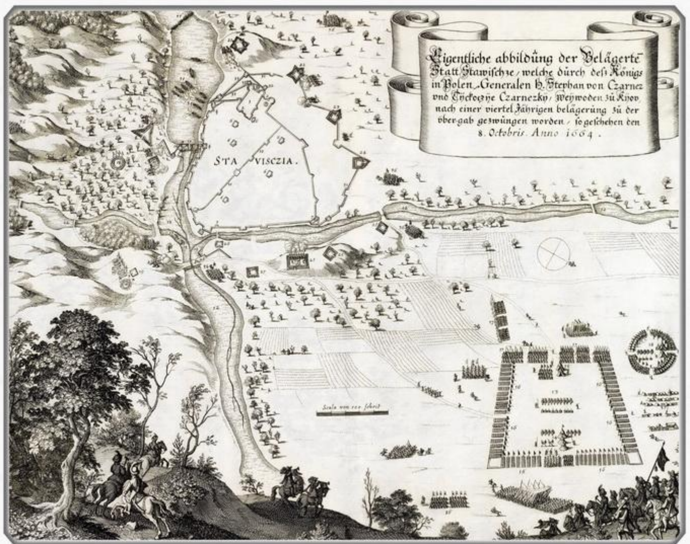
Гравюра облоги Ставищ 1664 року

и выразили непокорность Речи Посполитой. Усмирять восставших выдвинулись воевода киевский Стефан Чарнецкий и полководець Ян Собеский (будущий король Речи Посполитой) со своими полками и татарской ордой. Они послали парламентария с предложением сдаться, но жители Ставищ встретили его с насмешками. Чарнецкий приказал насыпать валы и идти на штурм, но сразу погибло много поляков. Тогда Чарнецкий велел татарам сжечь все окрестные хутора и фольварки и взять Ставища в блокаду. Но, как писал Чарнецкий королю, что по всей Украине существовала такая ненависть против Польши, что Украина готова скорее умереть, чем поддаться ей. Штурмы и обстрелы с орудий продолжались четыре месяца. Наступали холода, а все жилища были уничтожены канонадой и ставищане не могли больше выдержать голод и сдались. В Ставищах опять был размещен польский гарнизон.