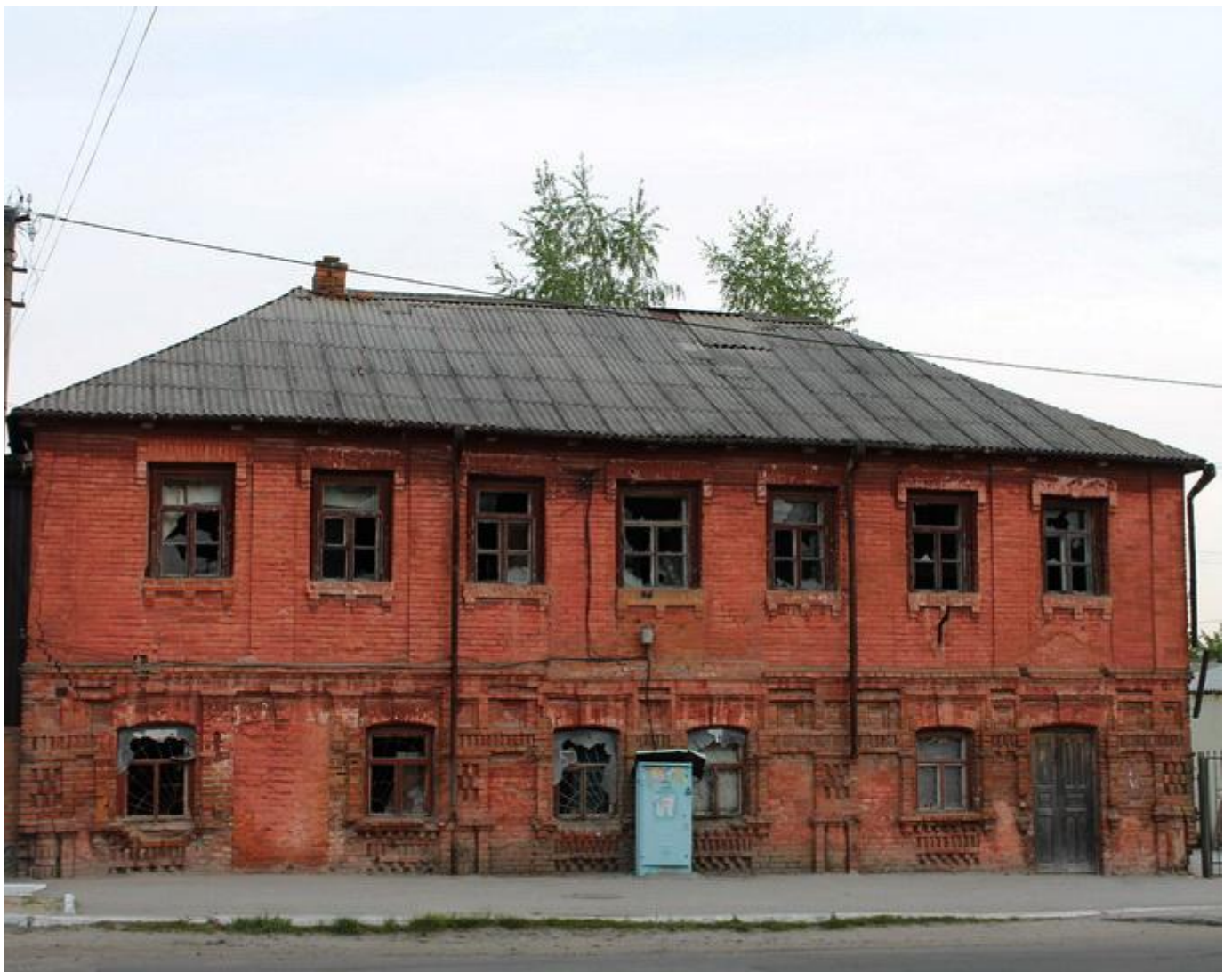
Старий єврейський будинок

ул. Цимбала Сергея, (бывшая Советская), 75 Координаты: 49°23'01.4"N 30°11'53.4"E