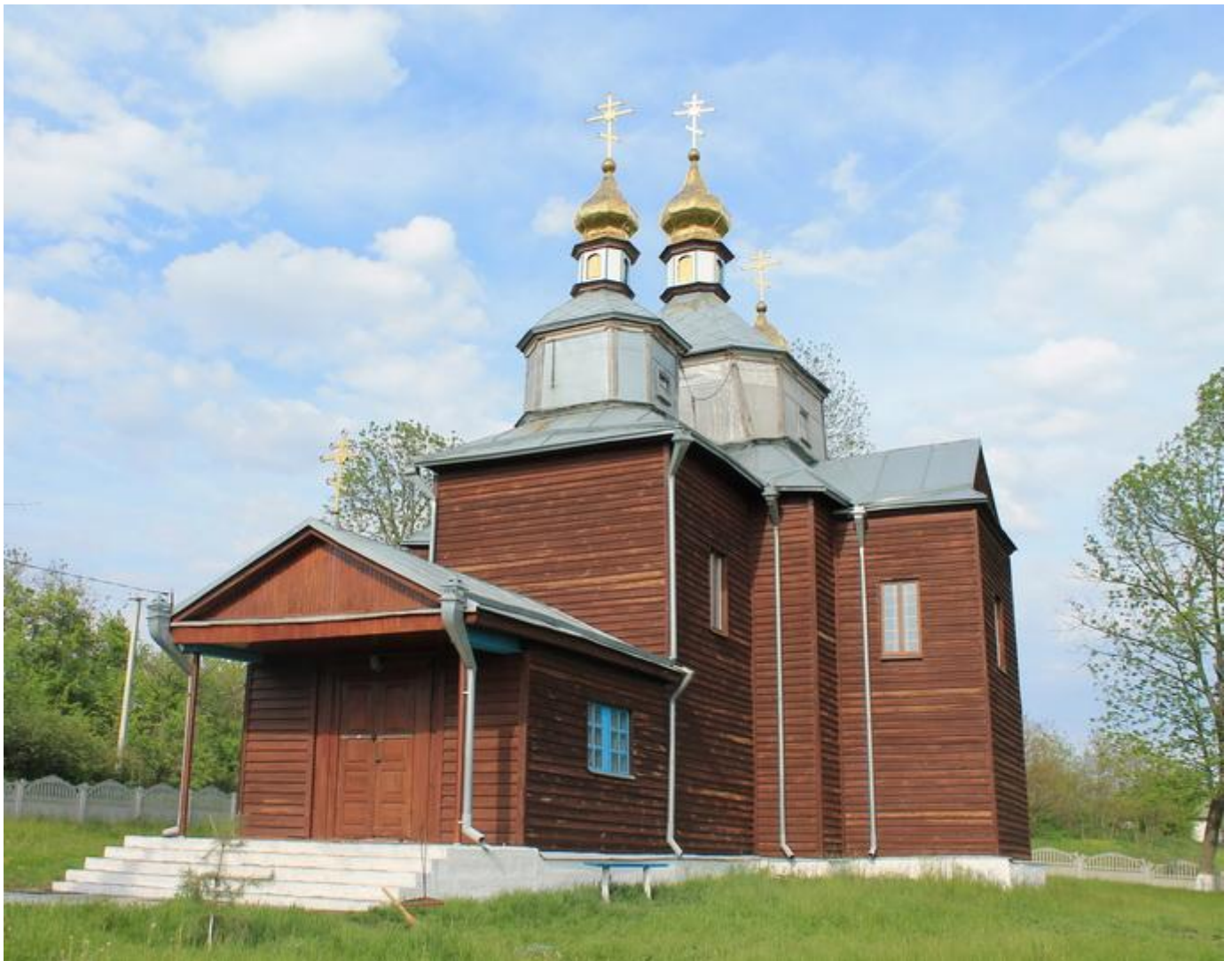
Церква Різдва Пресвятої Богородиці