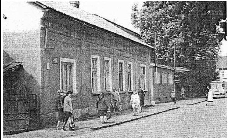
בוחר יסופיט ריעב טסוח