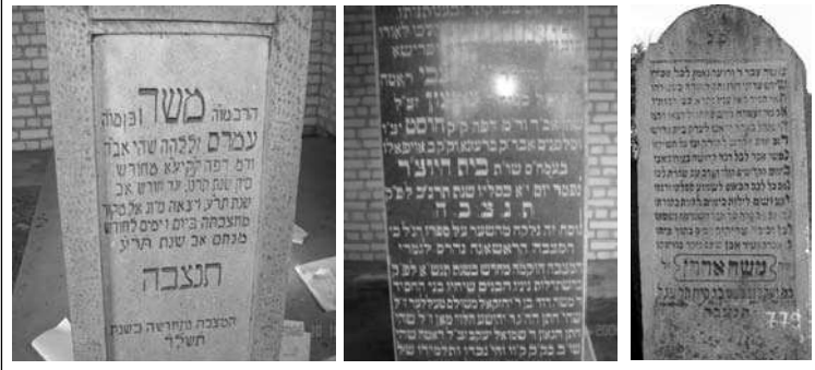
הבצמה לע רבק "לעב תגורע משבה"