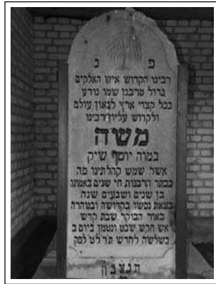
הבצמה לע ורבק לש מ"רהמה קיש תיבב תורבקה טסוחב

מ"רהמ עדונ רקיעב תוכזב ת"ושה ולש - ת"וש מ"רהמ קיש, ובו לעמ ל-1,000 תתובוש התויתכל שהביש בלכ ניאשו המייה כומ כן חרבי מישוריפ על ההרות, על פיקר אתוב, על ההדג של פחס, על תג"יר מתווצ (המודב לתחנמ חקוני), ומישודיח על הס"ש לינפ פותרט סלב ממירוסיי מישק רתויב רטפנ אב' טבשב ט"לרת'ה) 1879) ותחונמו טסוחב