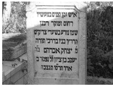
קזיזיא רבייע סיו

ינפל שונאצי מריעה ננעסו לתואר את הלובג של אהניארקו והינמור לע רהנ הסיטה רבעב רשאכ יבא יבס דלונו הלע רהנ הסיטה לע ויתודג ללגב שהדגה התינמור שול) תימורדה) ההתי גההוב מוז התינופצ חורד סימה לרוזיא המירוגמ כרשא בושק לתונפ את התדלוי למוקמ גהוב