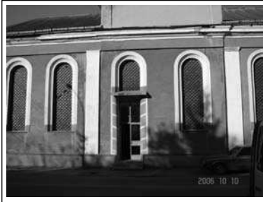
תיב שטעטב תסנכה מויכש שמשמ ןודעזמכ טרופס

רחאל וניצימש תא רויסה ריעב חסוט נסעונ לערי טטעש תאצמנה ממורד מחרז לריע טסוח לרחא כיצה שהע של העיסנ ונעגה זכרמל ריעה המל היהש בתי הסנכת היזכרמ של ריעה) האר הנומת)