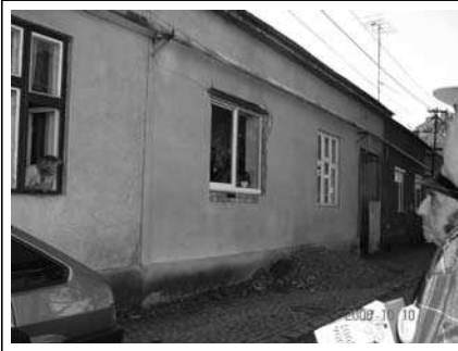
תיב תסנכה ןטקה דומצה תיבל תסנכה לודגה ובש מג מילפתמ מויכ

ונשגפ בתיב התסנכייידה משב קנייל שאוה הידוהי ידיחיה שדלונ בריע חטסו (ב-1928) וןיידע חי בה לרחא החיש עומ ורויס בתיב התסנכ הוא לקח אותנו למקום וירבדלש ההי התיב של מהש טרשטע (בוחרב נעיי גסא) רורבב שרחאל מהשע עם ציב שָׁרוּו ז"ל מררבת שייתכן שהדוד נתפילו היה גר שם (האר הנומת)