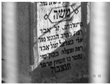
ברה השמ מיובלטייט בר ריעה