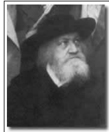
ןואגה ר' פסוי יבצ ר"ב לארשי יקסנישוד ל"צז

ר' יפסו ציב דיקסנישו נרטפ במילשורי בברע סתוכו תט"ש) 1948) וייחב לא נספד אאל חרובי אדח שול, בתפוקת רותונב באטנאלאג רחאמ רטפנו ךלהמב תמחלמ רורחשה רבקנ בתיב תורבקה דילש תיב מילוחה ירעש קדצ ןשיה