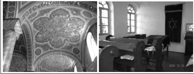
תרקת תיב תסנכה לודגה