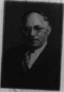
סאר יאנער ערשטער פרעזידענט

אלס דער ערשטער פרעזידענט, וואס האט געהאט דעם כבוד און פארעכענישן צו זיינע אונזער סאביעטיש פאר די לעצטע טען צוואנציג יאר, און דורך אים דער צייט צו פארשטעלן איר אונזער "אונזער-דענק וויכטיגע אספעקט, בין איר סטאלין און מילקין צו באגרייפן זיינע שווערע פער און כוונה צו אונזער דרייטן יום טוב