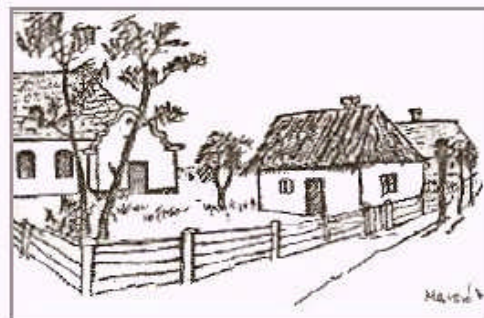
Zelk Zoltán szülőháza, háttérben a zsidó hitközség imaháza a Kisújvárosban Marcsó József szénrajza