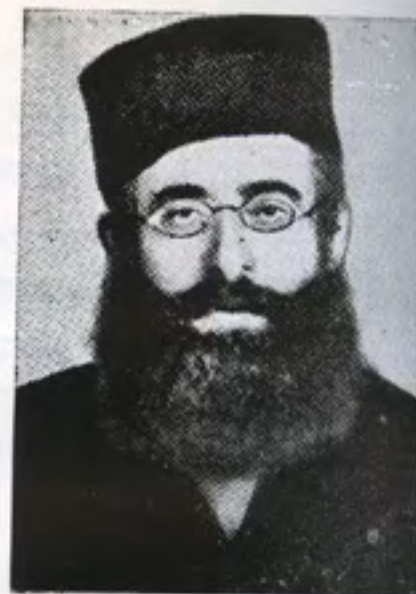
הרבי ר' ישראל פרלוב

היתה לו אורוה עם סוסים אצילים, ומרכבה נאה, על ארבעה גלגלים, עם בעלי העגלה — הרבה לשוחח ועם פשוטי העם — אהב להתוכח.