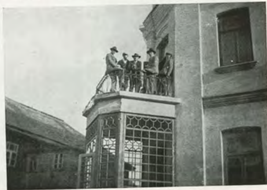
הבית החוש של הרבי משה'לה עם ה„פלוש“ של בית המדרש די נייע שטוב פון רבי משה'לה מיטן „פלוש“ פון בית מדרש