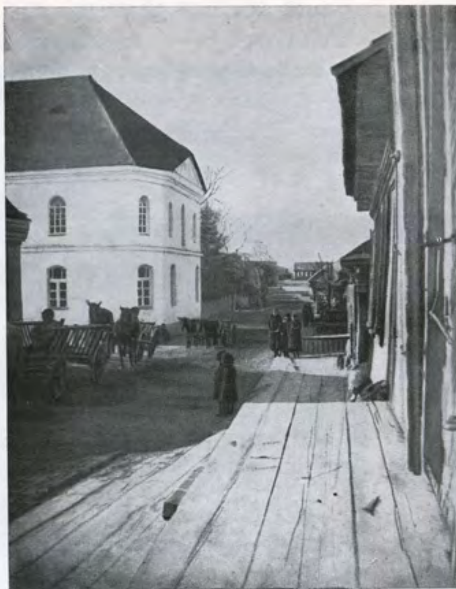
רחוב הרבי עם בית הכנסת הגדול הלבן דעם רבי'נס גאס מיט דער חייסער שול

יאחרי בית הספר — ודאי שנוכיר. אותן תנועות נוער — שנוסדו אז בעיר, אשר דירבנו בלי הרף — ודרשו אז בגאון, לתת יד לתקומה — ולהגשים החזון.