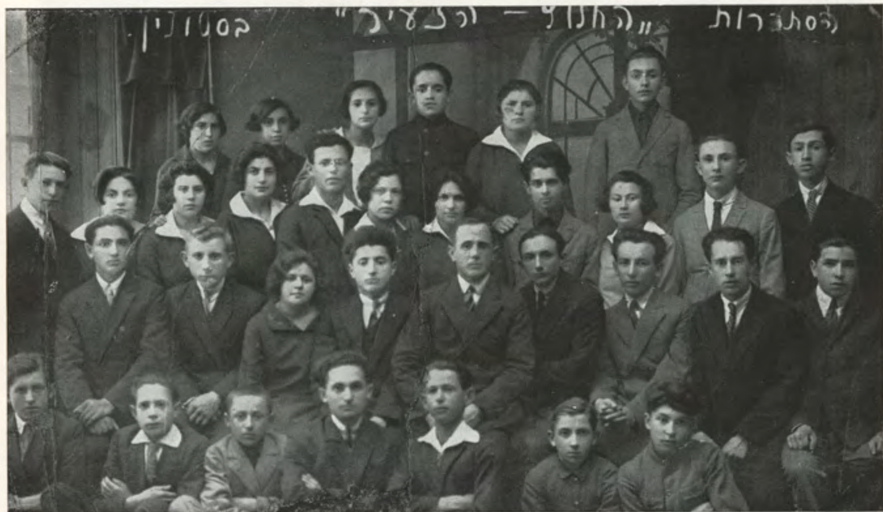
הסתדרות "החלוץ הצעיר" בשנת 1926