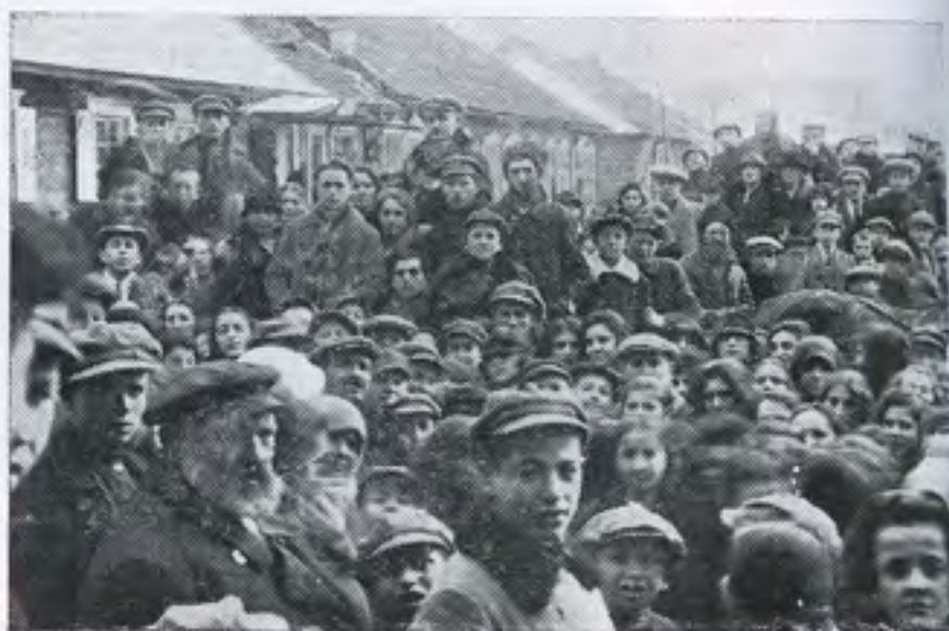
בני סטולין נפרדים מעולים לארץ ישראל בשנת 1927