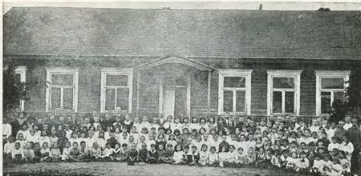
בית הספר וגן הילדים "תרבות" בשנת 1919