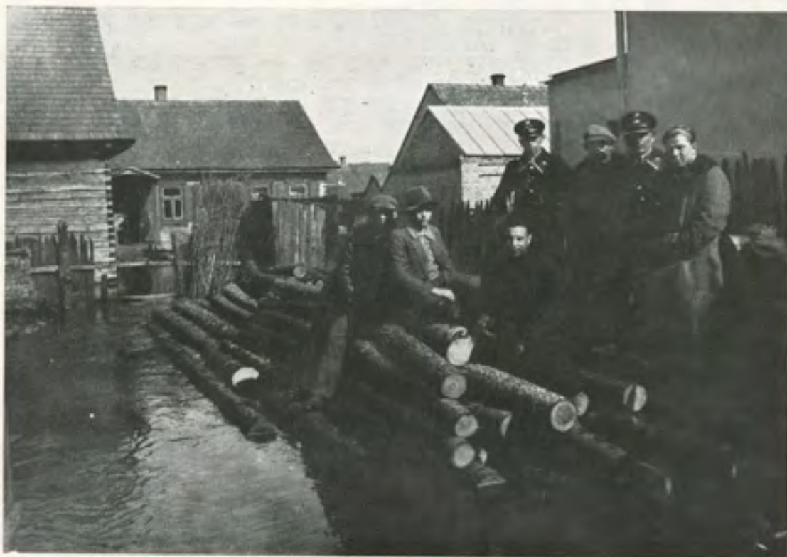
ווען דער שניי צוגייט

יעצט הערט זיך צו, וואס איז געשען א מאל, אז יעקב דער שמש, האט אויסגערופן אויפן קול,