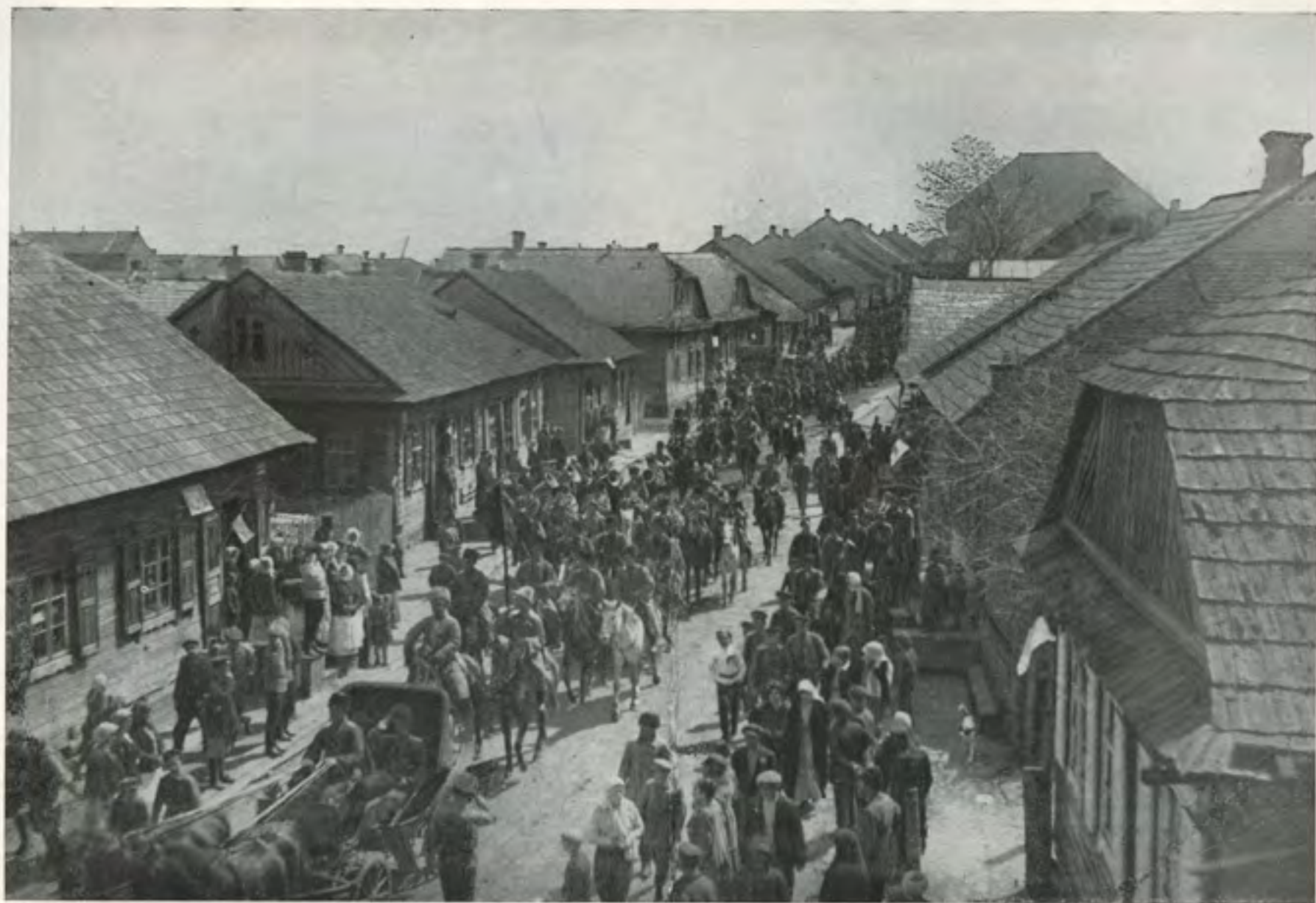
דעם רבע'ס גאס פאר דער שרפה