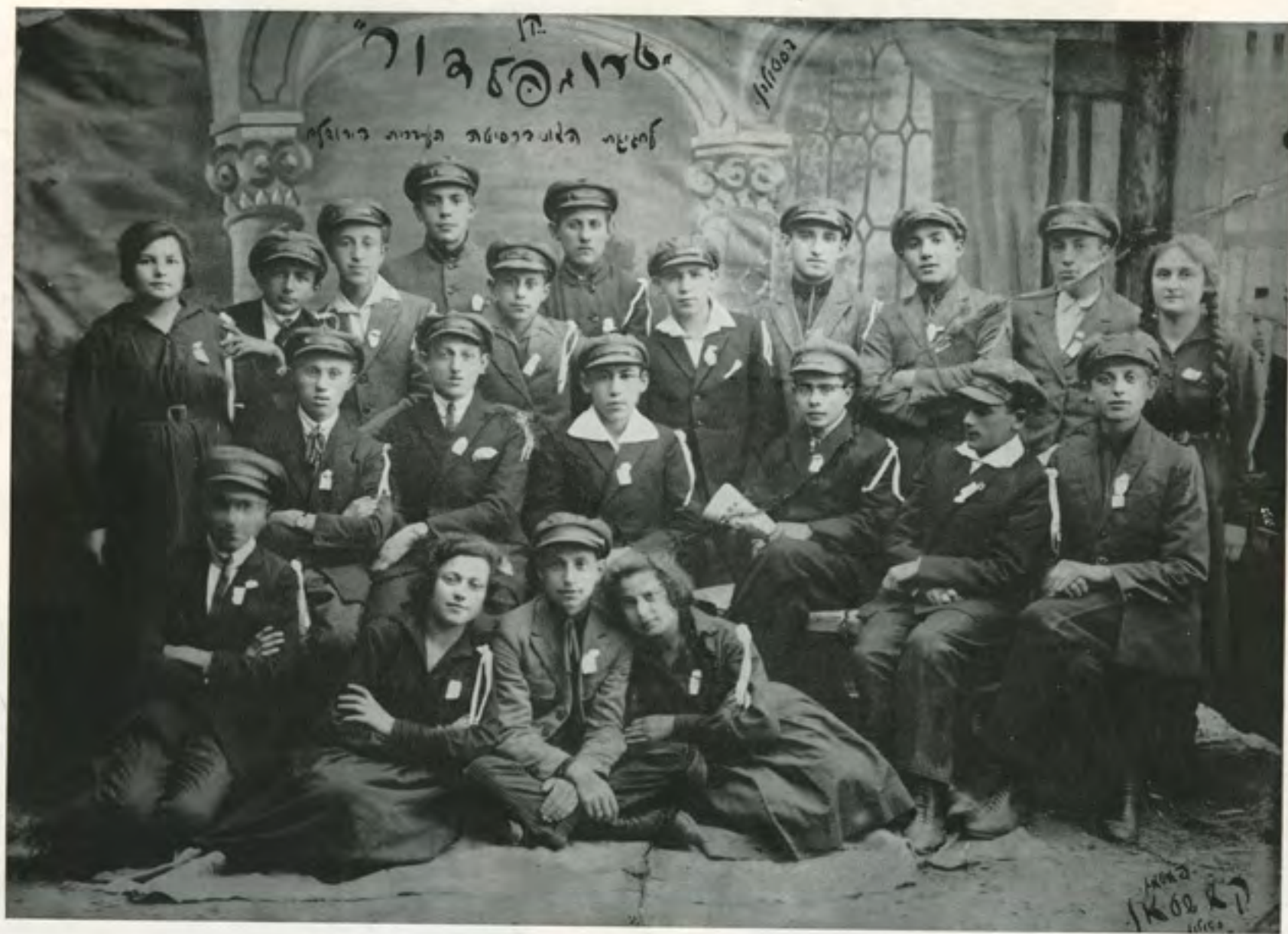
הסתדרות "ברית טרומפלדור" בשנת 1925 בסולין