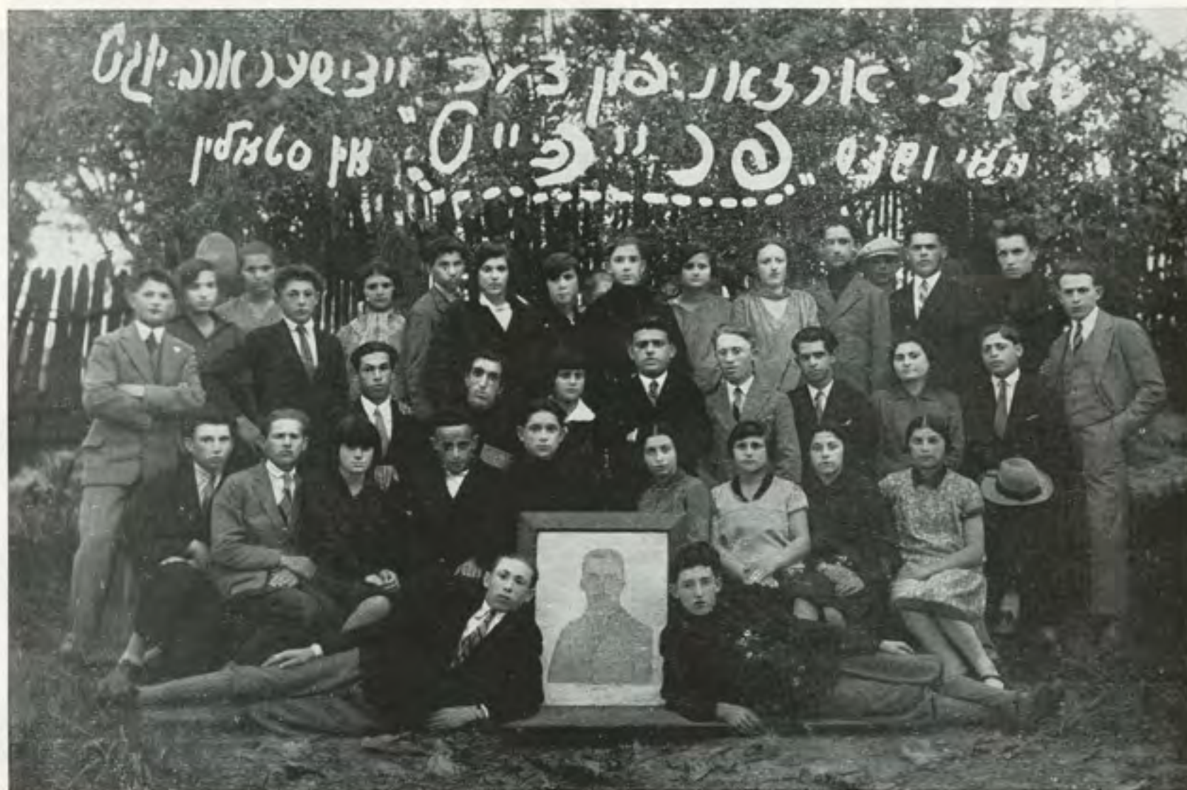
הסתדרות הנוער "פרייהייט" בשנת 1930