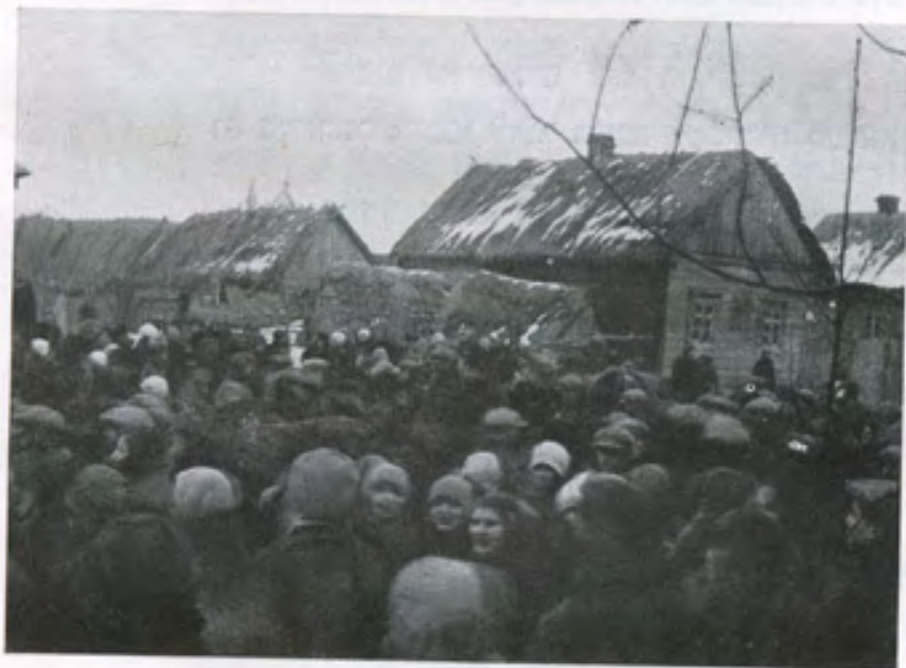
בסוף רחוב דומברוביץ קבלת פני חתנה של חנה־ילה בת הרבי בשנת 1928

ישבו בה „אדמורים“ — משושלת פרלוב, ועל שמו של ה„רבי“ היה שם רחוב, עם בית כנסת לבן, גדול, מפואר, ומכל זה, לדאבונו, זכר לא נשאר.