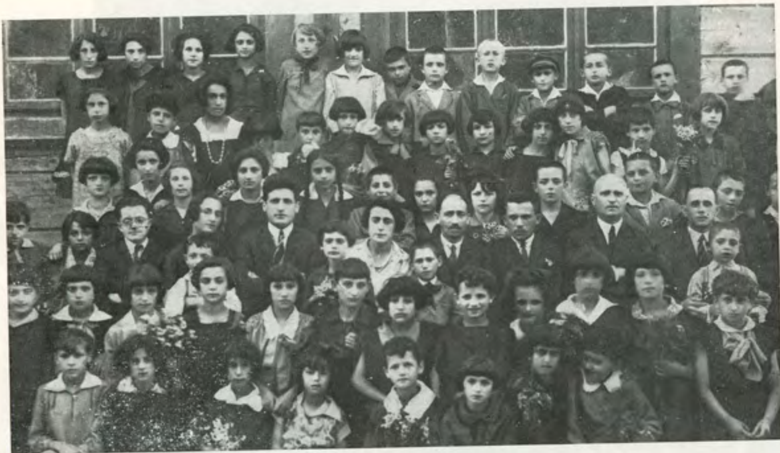
כיתה ד' של בית הספר "תרבות" בשנת 1925