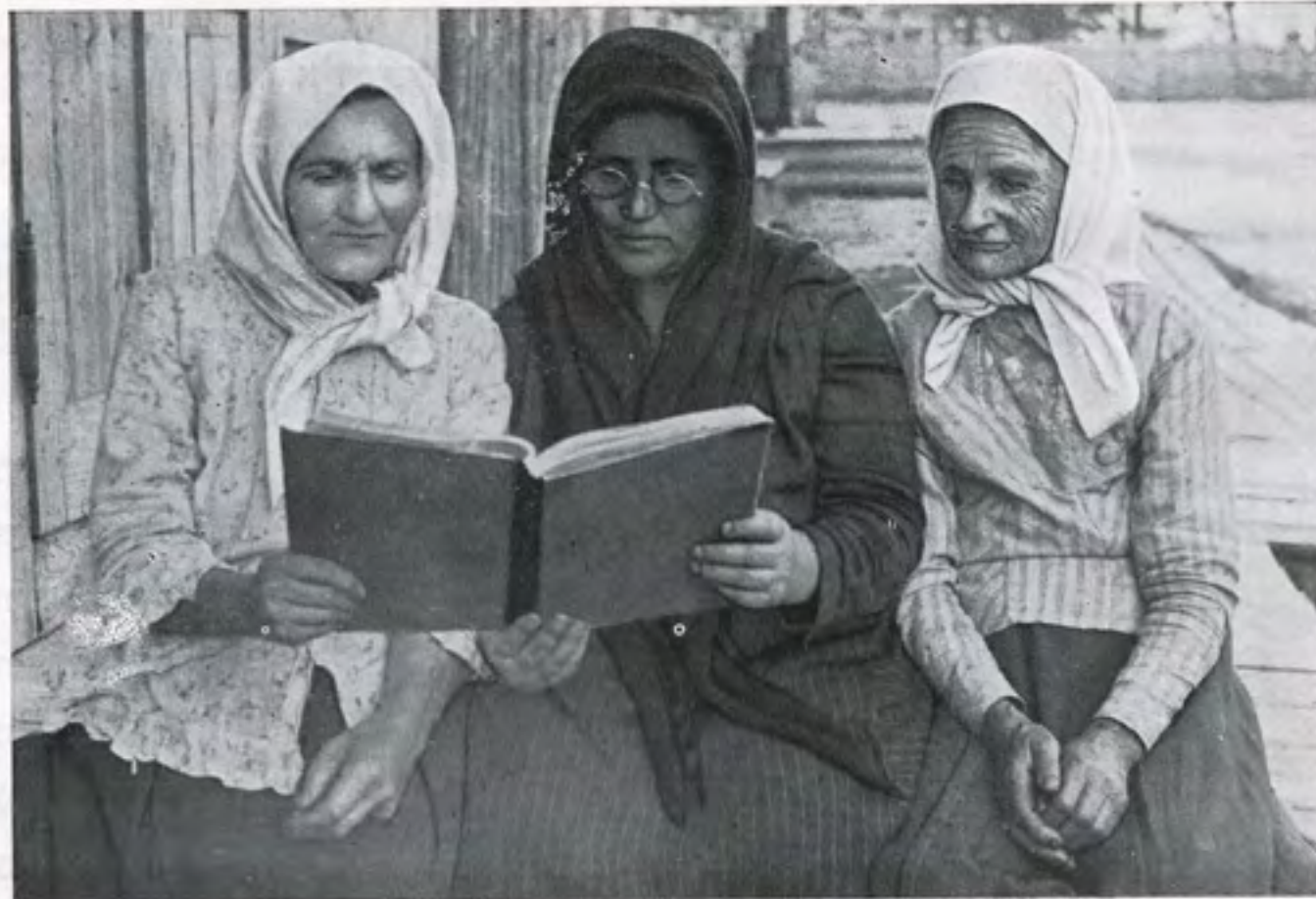
סטאלינער יידישע מאמעס