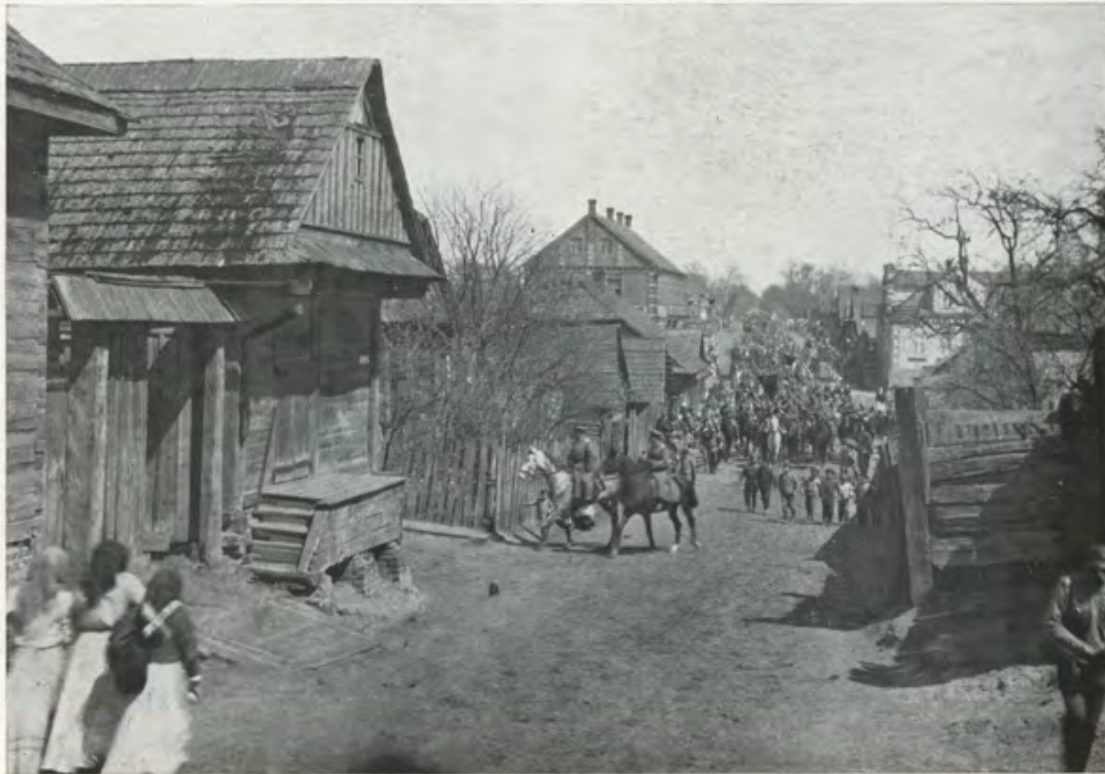
האַראַדאַקער גאס 1918

די גאס, אט די לאנגע, ביזן מאנקעוויטשער טויער, אהין וועלן מיר קומען — צו שפעטער, צו פריהער.