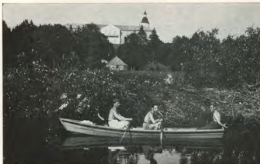
נהר הורין בצד „פאדגוריה“ וארמון הנסיך רדזיביל די טייך הארין ביי פאדגוריע מיט ראדזיווילס פאלאץ

טאָ לאמיר שוין בעסער — זיך לאָזן אין וועג, און גיין יעצט וואס שנעלער, צום פאָדגורייער ברעג, כל זמן סאיז ליכטיג — מ'זעט נאך די שיין, קומט לאמיר אלע — אין טייכל אריין.