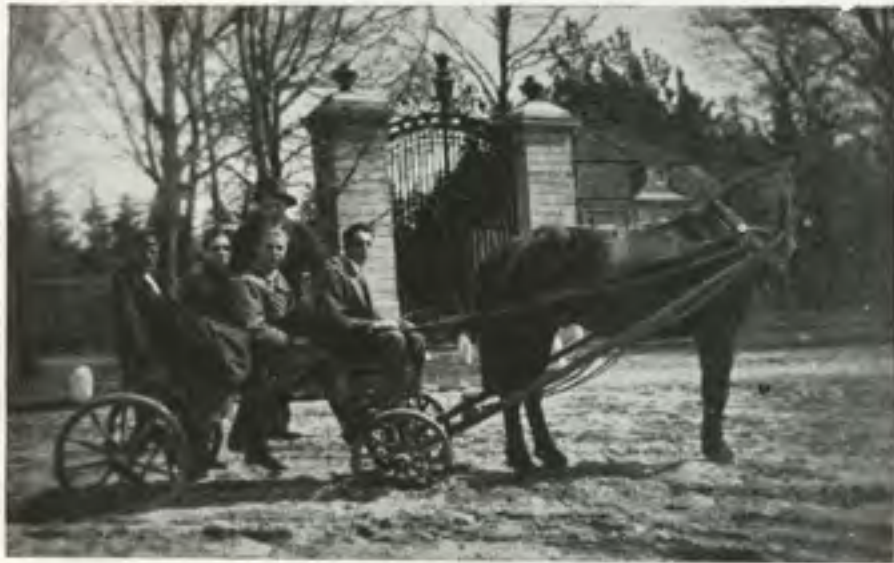
דער מיינקעזיטשער טוייער

מיר דארפן פארענדיגן — אונזער שפאציר, כאטש זכרונות איז נאך דא — אָן א שיעור, טאָ זאל זיך אונז דוכטן — אז דאס אלץ איז געשען, זיך א ביסל פארמאטערט — אבער ס'איז כדאי געווען.