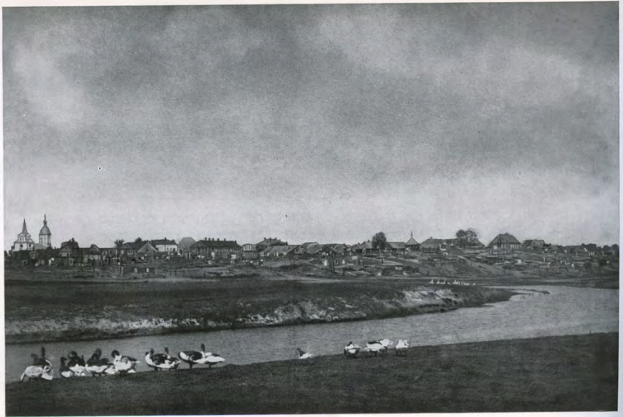
מבט על העיר מ"הקופאניעץ"