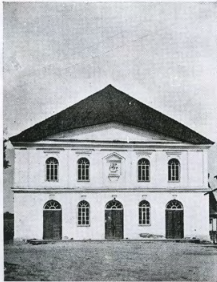
די גרויסע שול

די גרייסע שול (די ווייסע) דעם רבינ'ס שול דער בית מדרש די בערעזונער שול די מתנגדישע שול דער ציוניסטישער מנין די שול פון די פלעצער