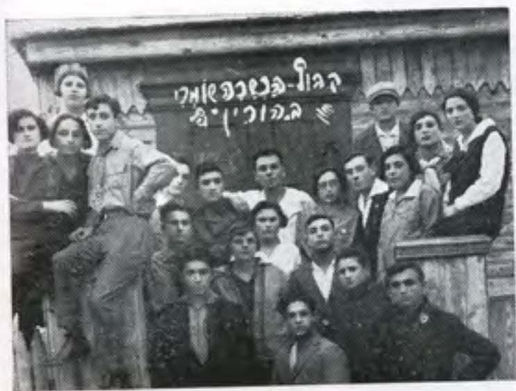
קבוץ הכשרה בהורין