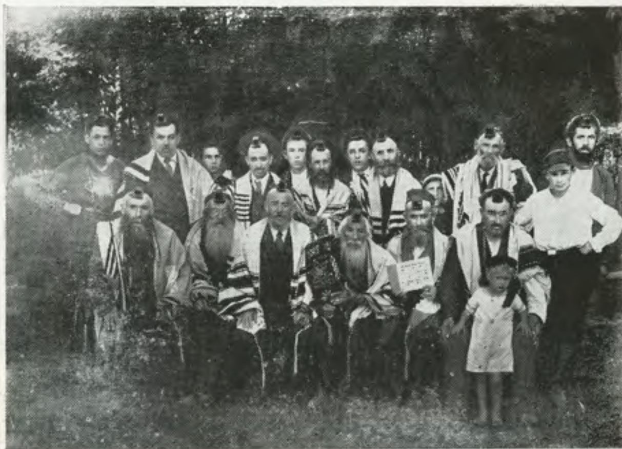
בני סטולין בקייטנה זאטשישה עם גודל החון באמצע אין זאטשישע מיט גאָדל דעם חון אין מיטן

לאמיר זיך היילן — און נישט פרעגן קיין „קאשע“, אט גייען שען די בהמות — צוריק פון דער פאשע, אט פירט שען „איוואן“ — די חורים אין סטאדע, און „אינאטקא“ איז אוועק — אין שיינק אוודאי.