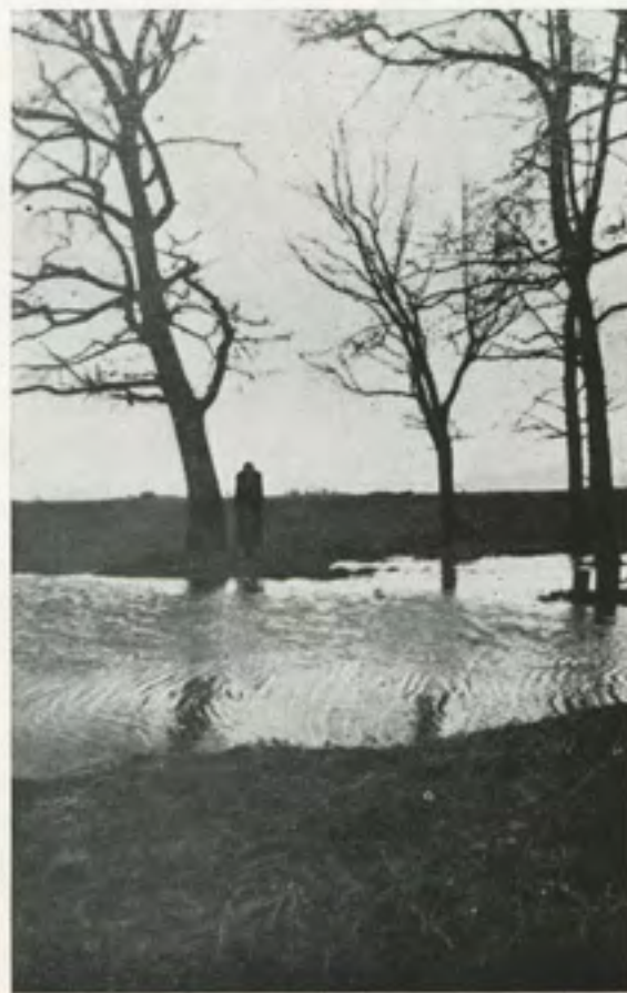
בדרך לדולין בחורף אויפן חעג צו דאָלין אין חיינטער

די זון וועט אראָפּ און טונקל וועט ווערן, אין הימל וועלן זיך בעווייזן — די ערשטע שטערן, דאן וועלן מיר גיין — אויף דער סטעזשקע פון דאָלין, וואו די דייטשן האבן פארטריבן די יידן פון סטאַלין.