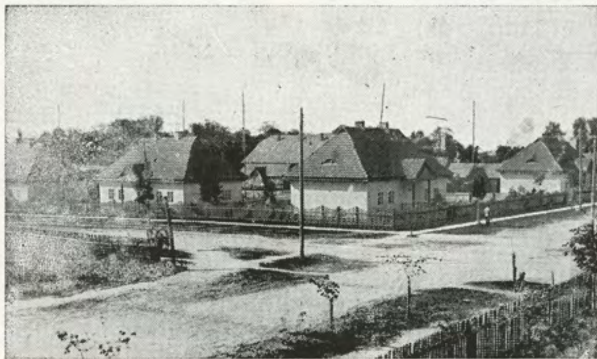
די נייע פלעצער

נאכהער אויף די פלעצער — די נייע די שיינע, וואו מיר האבן זיך געשפילט — ווען מיר זיינען געווען קליינע, און די פעלדער די גרינע — האבן געהערט אט די קלאנגען. פון ציוניסטישע לידער — און חלוצישע געזאנגען.