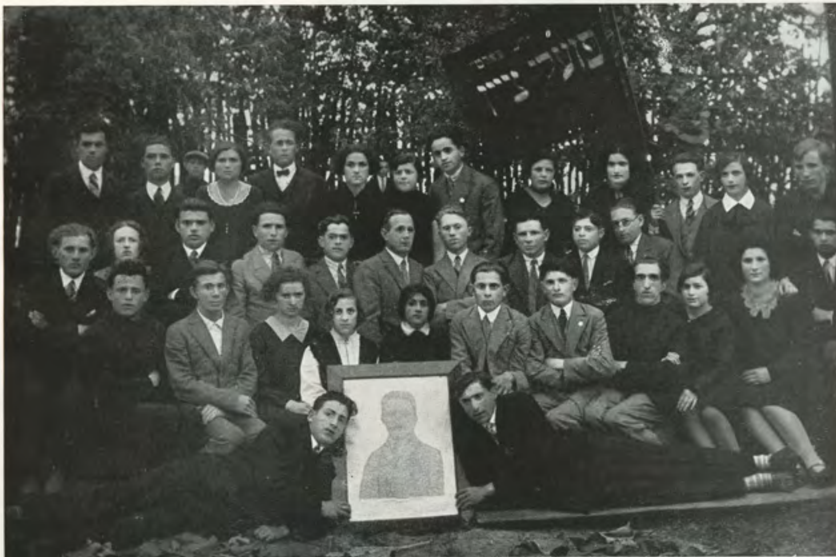
מפלגת „פועלי ציון“ בשנת 1930