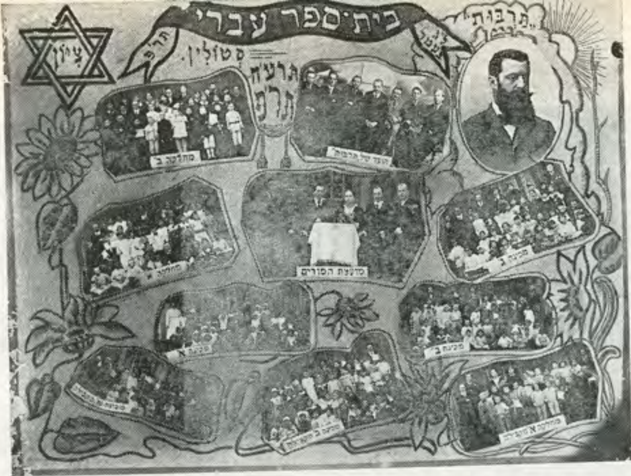
כיתות בית הספר "תרבות" בשנת 1920 עם חבר המורים וועד בית הספר