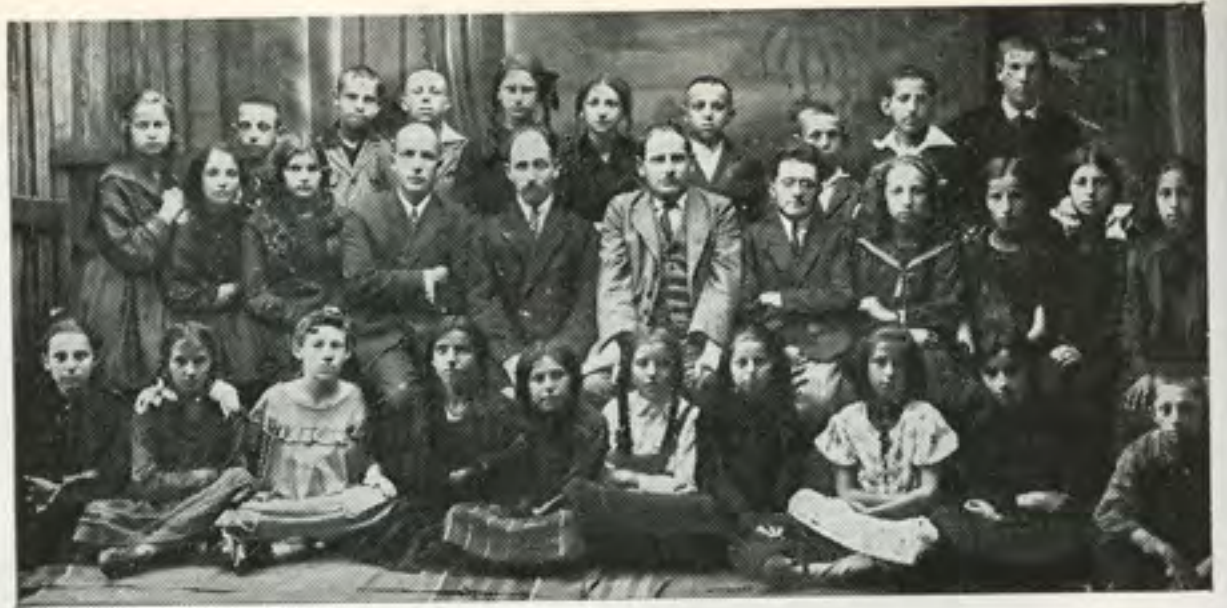
כיתה ג' של ביה"ס תרבות בשנת 1923