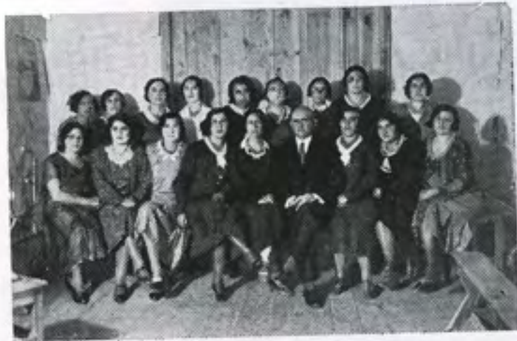
ועד בית היתומים דער בית יתומים קאַמיטעט