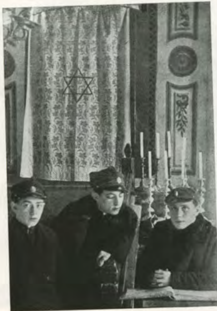
„ארון הקודש“ בבית הכנסת הגדול דער „ארון קודש“ אין דער גרויסער שול

„שלום עליכם“ וועלן מיר געבן—דעם רב מיטן גבאי, אפשר איז דאס א סגולה — צו באקומען עולם הבא, און ס'קען נאך אויך טרעפן אז ס'זעט זיין מיט הצלחה, און פון רבין אליין — וועלן מיר באקומען א ברכה.