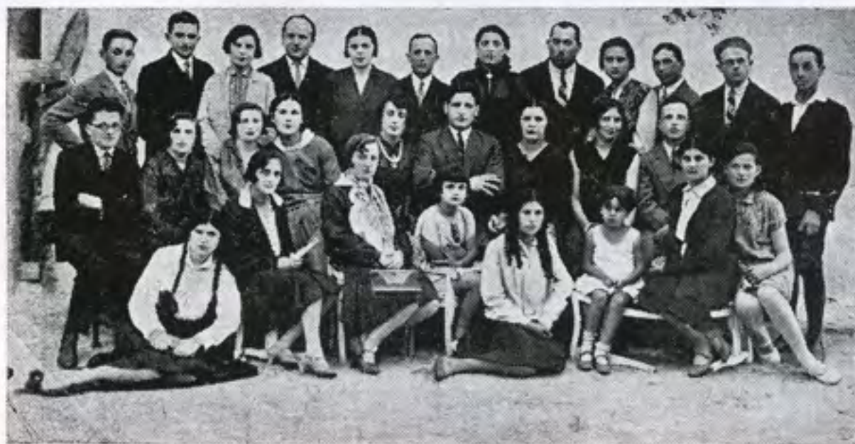
פעילי קרן הקימת לישראל בסטולין בשנת 1929