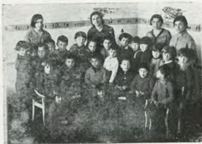
גן ילדים "תרבות" בשנת 1933