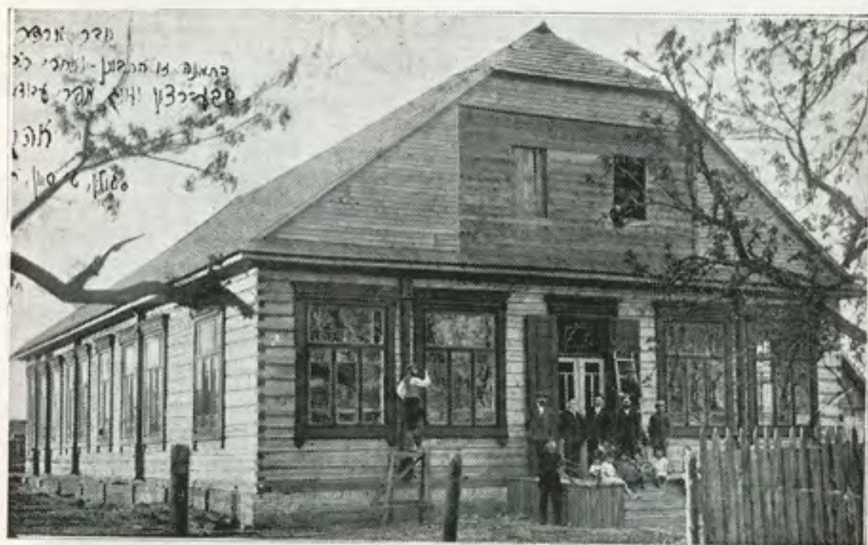
בנין בית הספר „תרבות“

א פערד קען דאס זיין — און אפילו א קליאטשע. ווייל מיר דארפן נאך בעזוכן די זאטשישער דאטשע. אבער אפשר איז כדאי — היינט זיך נישט זארגן, און דעם באזוך אין זאטשישע — אפלייגן אויף מארגן.