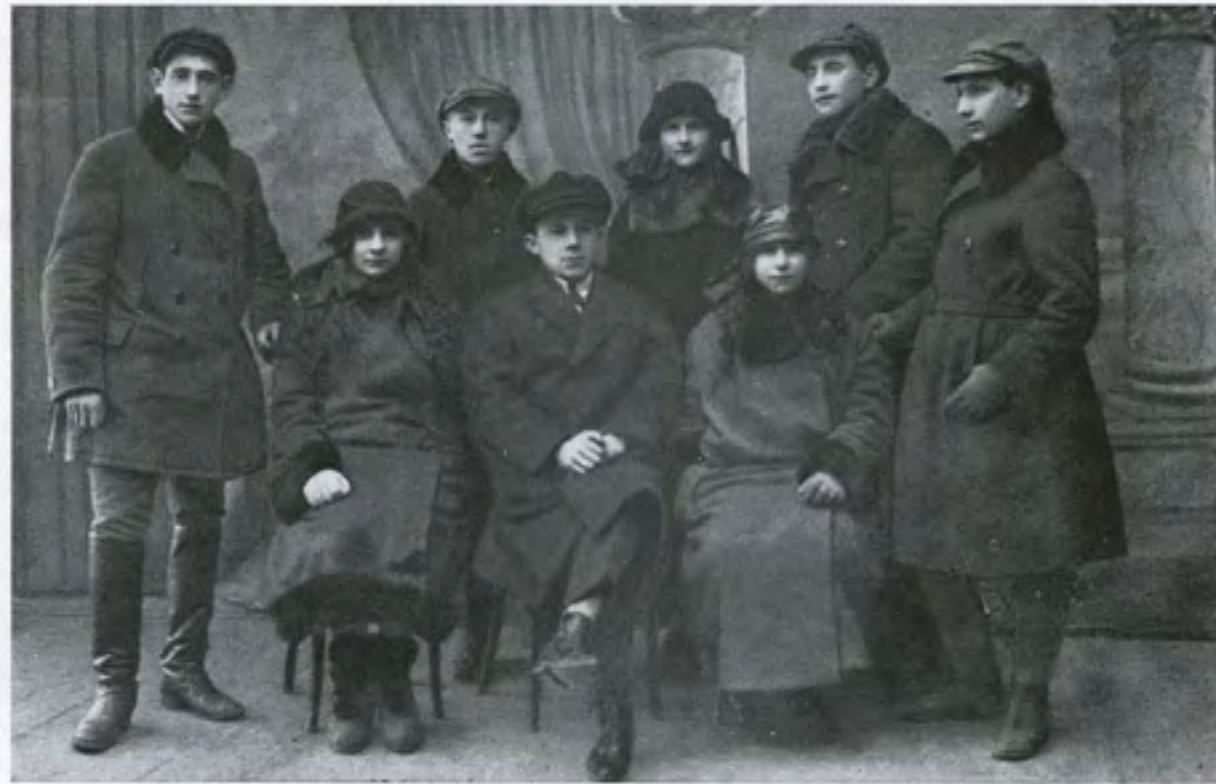
הנהגת „השומר הצעיר“ בשנת 1925