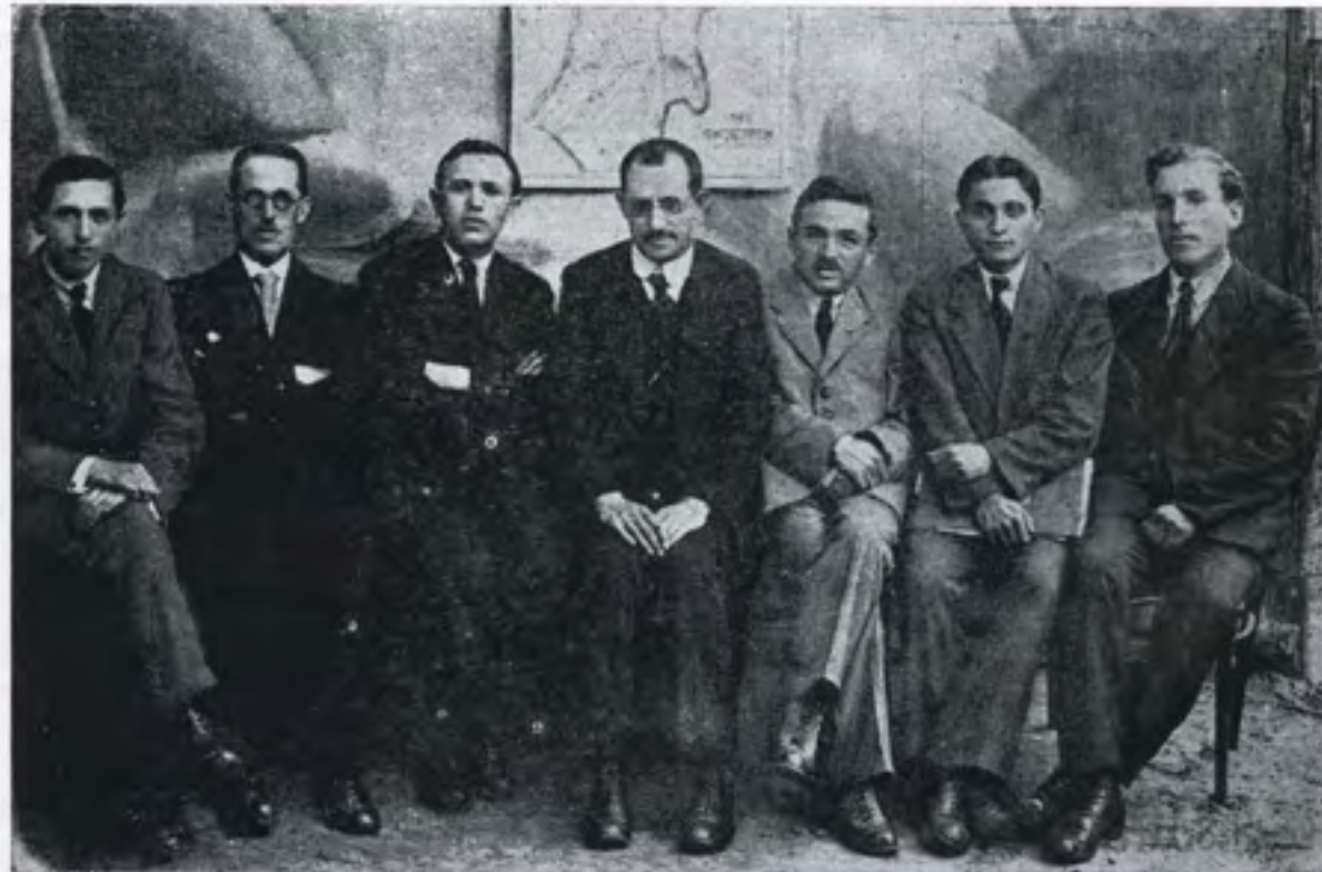
דער בית הספר קאמיטעט

עסן-ווארג (זאטערקע) פאר די בעזשענצעס וואס זיינען געקומען אין סטאלין. חברה ליצים פלעגט שטענדיק קריטיקירן די כלל-טוער פון די קאמיטעטן, און בא אונז איז פאר- בליבן אין זכרון א לידל פון יענע צייטן וואס כא- ראקטיזירט ווי אזיי עס האט זיך געפירט אזא קאמיטעט.