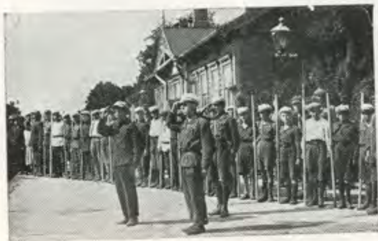
חברי "השומר הצעיר" נפרדים בהורין מדובויסקי בצאתו לאמריקה