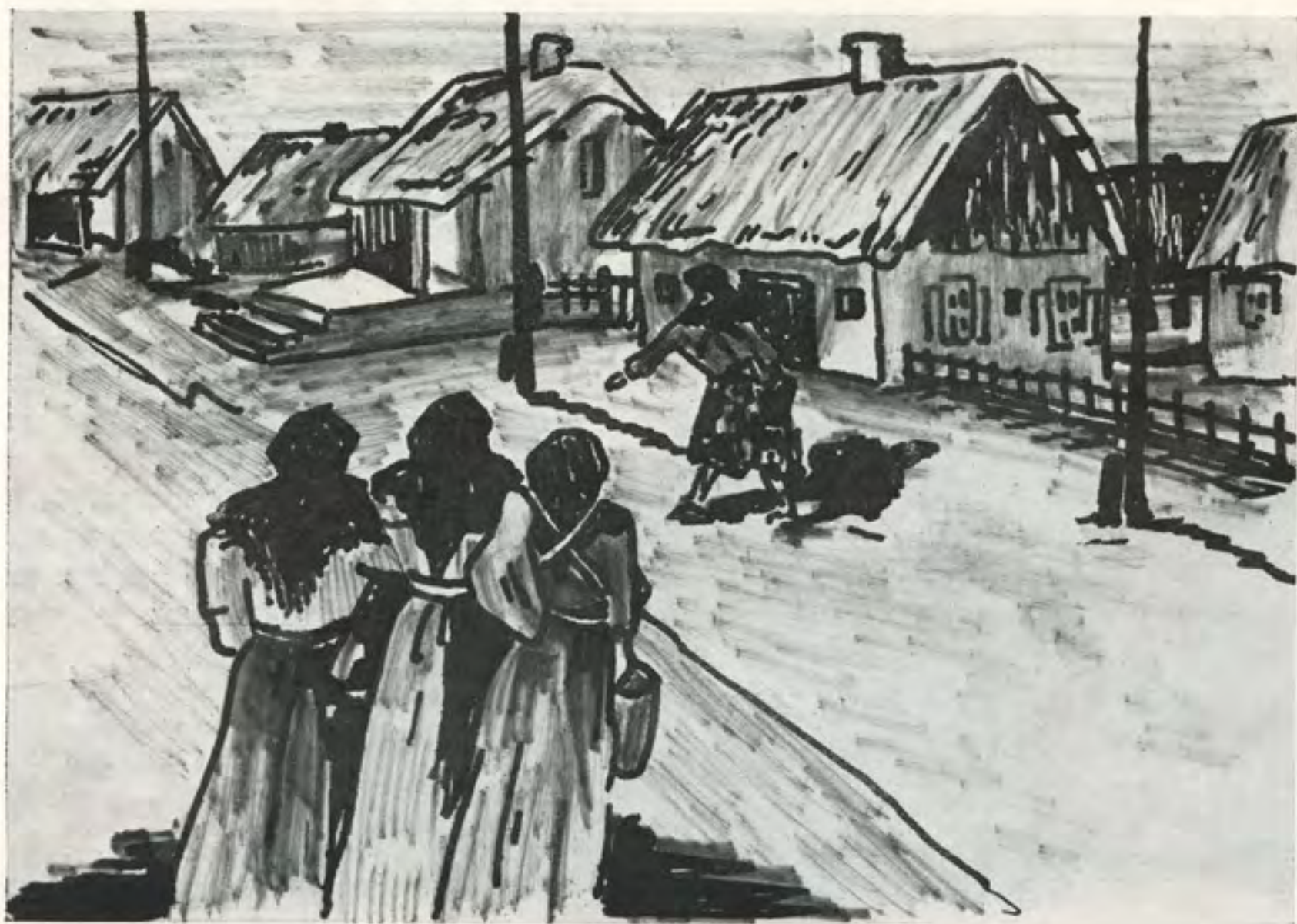
ביים סוף סוף שטעטל