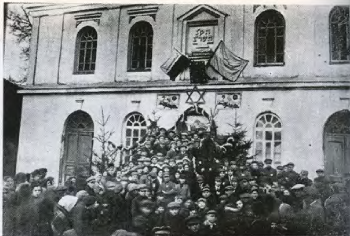
אספת עם ציונית ביום פתיחת האוניברסיטה בירושלים על יד הכנסת הגדול בשנת 1925