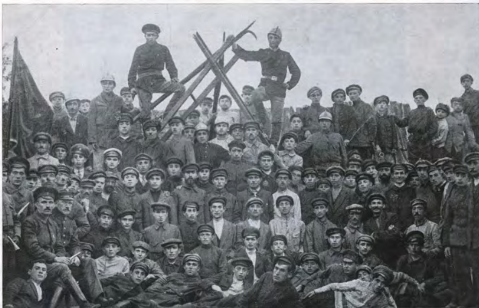
די פאזארנע קאמאנדע