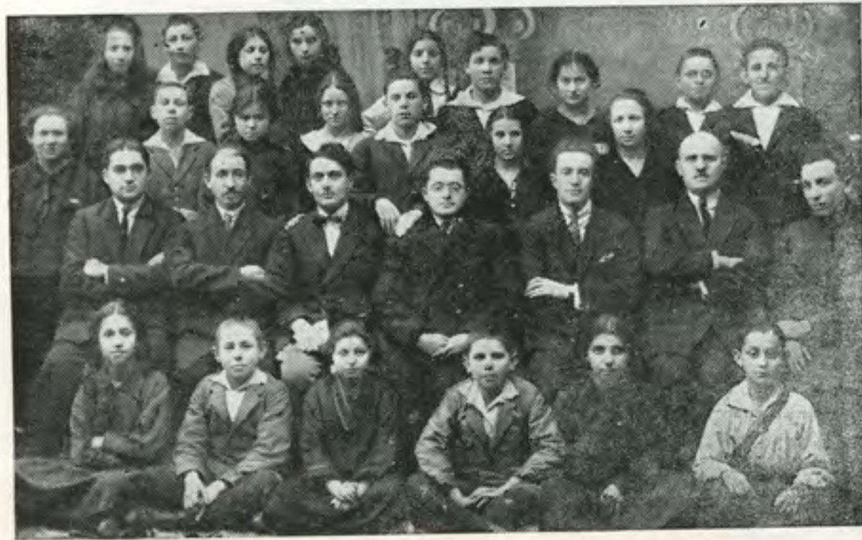
כיתה ה' של ביה"ס "תרבות" בשנת 1925