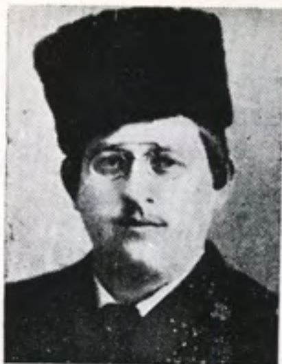
הרבי ר' משה פרלוב