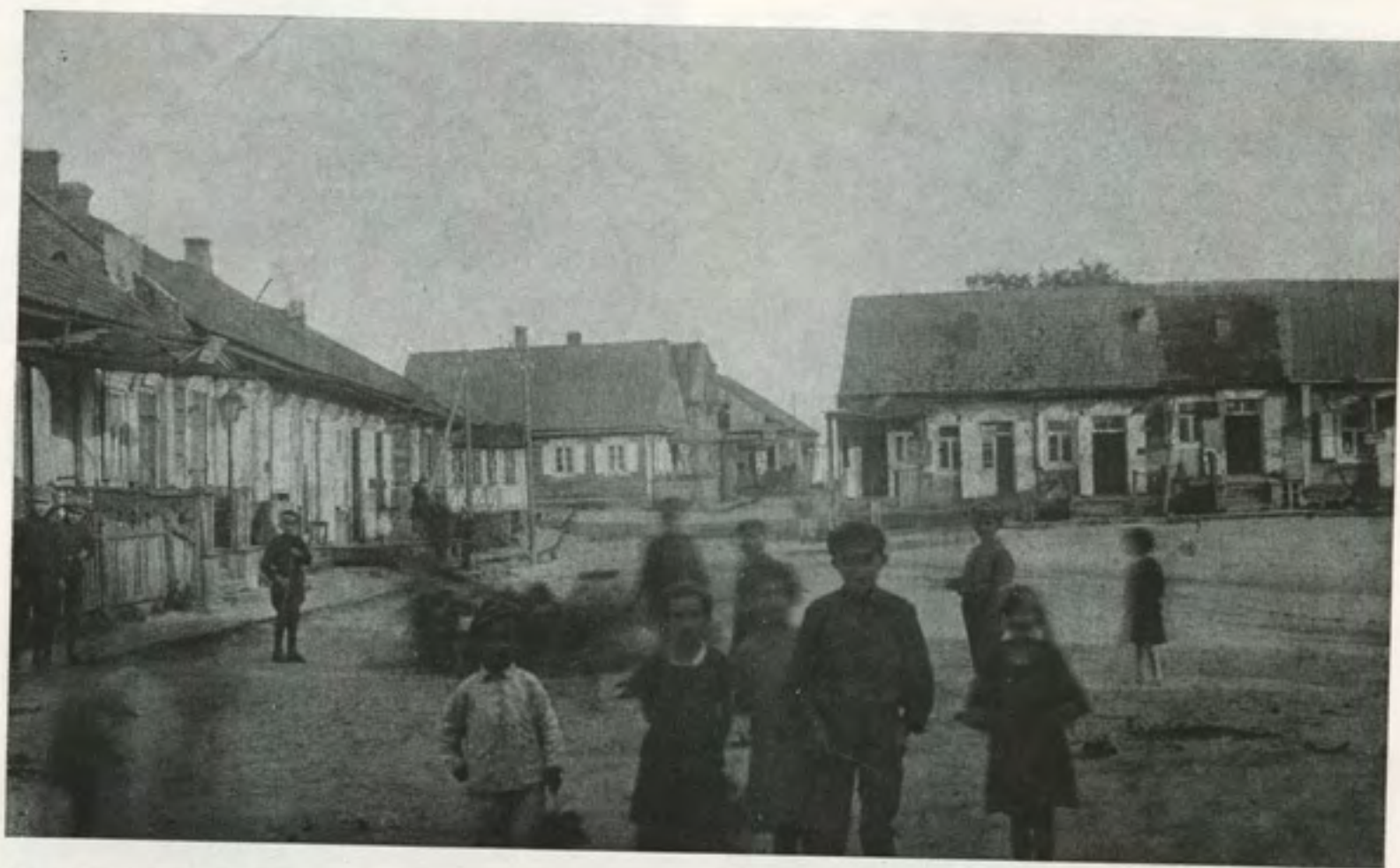
דער צחייטער מארק