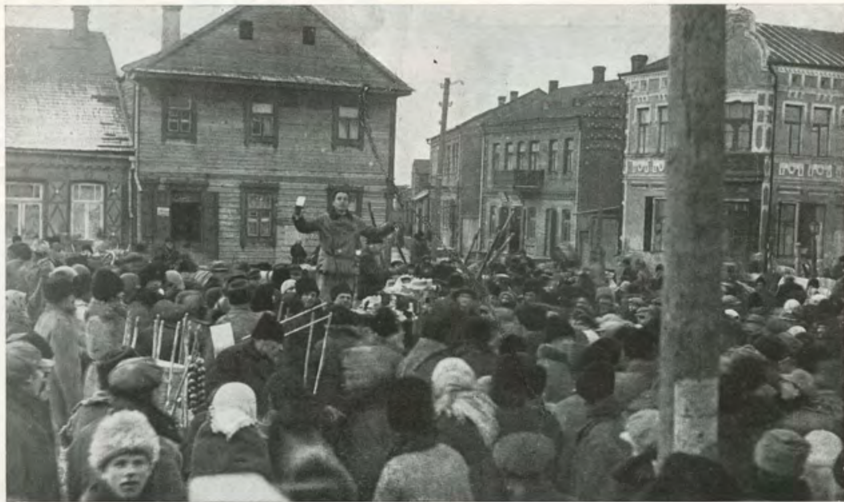
א יריד אויפן מארק