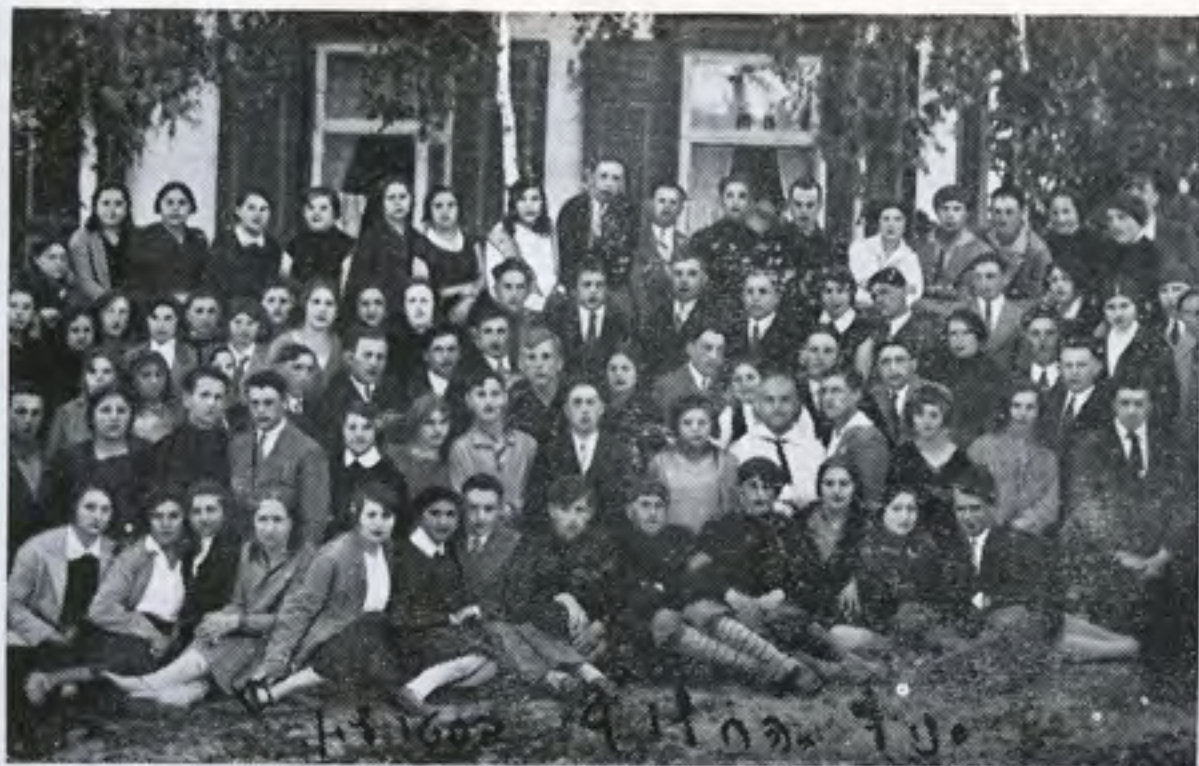
הסתדרות "החלוץ" בשנת 1927