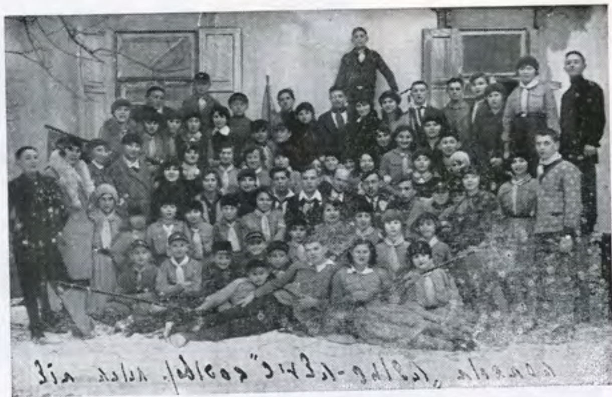
הסתדרות "השומר הצעיר" בשנת 1930