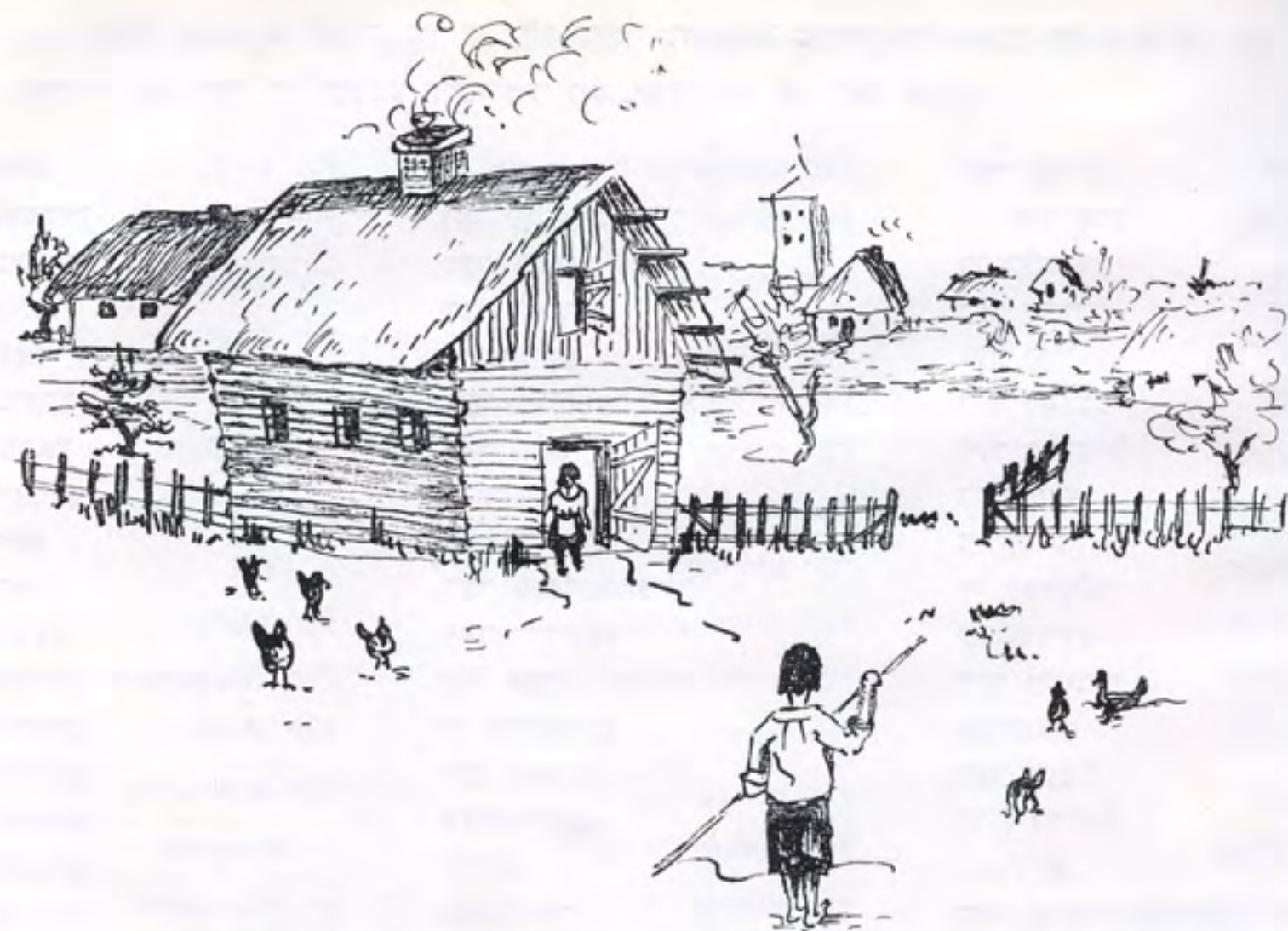
א שטוב אין דארף