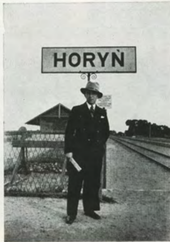
תחנת הרכבת „הורין“ סטאַנציע „האַרין“

זייט זיך מטריח, און צוזאַמען מיט מיר, לאַמיר איבער סטאַלין, מאַכן אשפּאַציר. זאל זיך אונז דוכטן אז ס'איז זומער פאַרנאַכט, און דער פּאַיעזוד האַט אונז, אין האַרין געבראַכט.