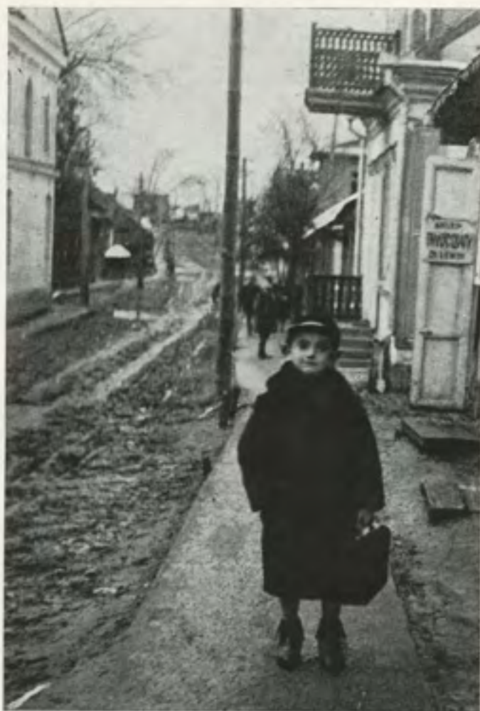
מילדי סטולין שניספו בשואה איינער פון די סטאלינער קינדער וועלכע זיינען אומגעקומען

בלייבן זאל ווי נאך אשלאכט נאר פוסטע שווארצע ווענט.