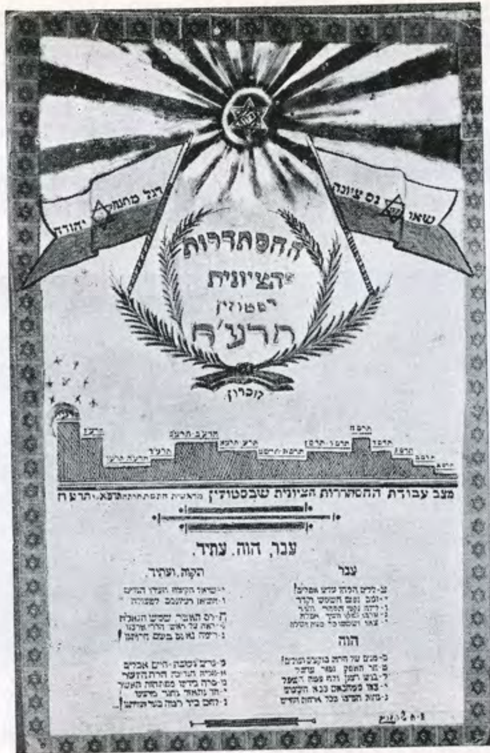
שלבי הפעולה הציונית בסטולין