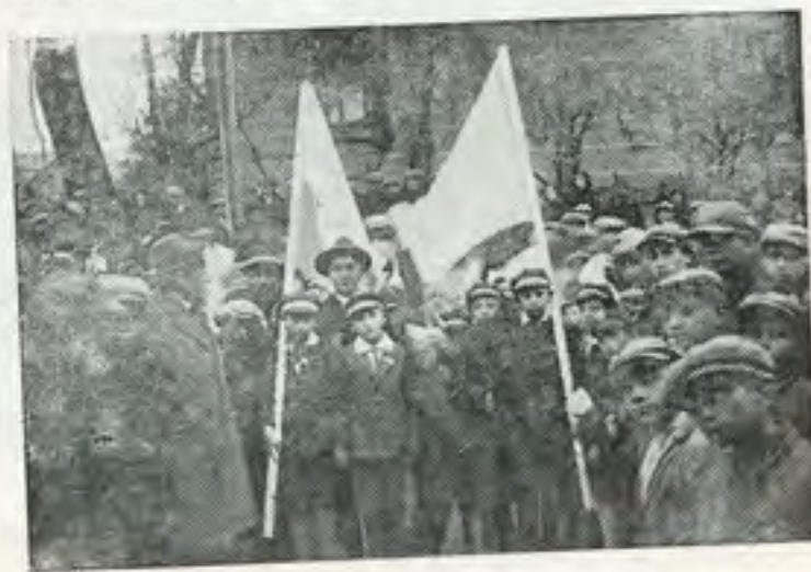
תהלוכת ל"ג בעומר של ילדי תלמוד-תורה