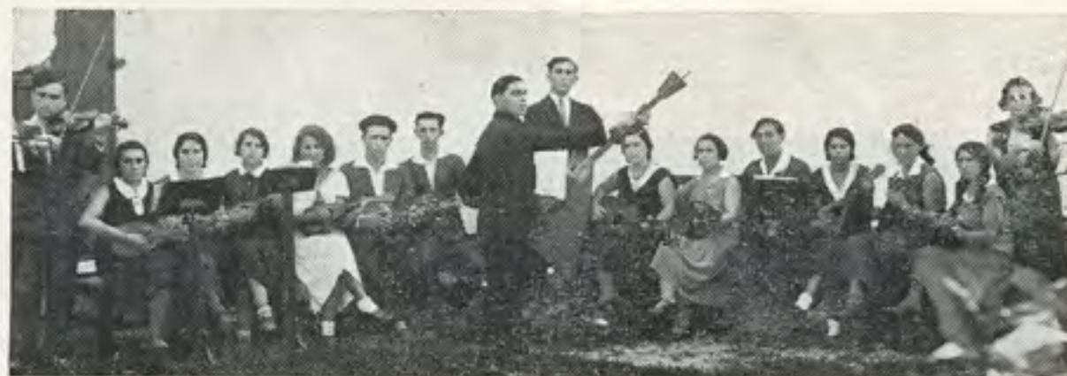
תזמורת הנוער הציוני בסטולין בשנת 1932