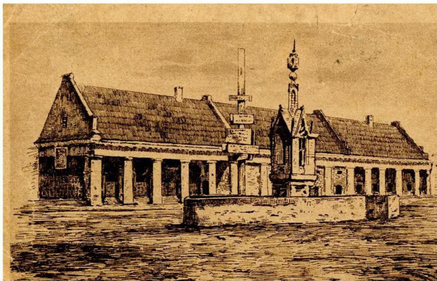
Rokiškis Pirmojo pasaulinio karo metų atvirlaiškyje. RKM 45694

1897 m. žydai sudarė 75,5 proc. Rokiškio gyventojų. Rokiškio miestas išaugo. Apie 1910 m. mieste buvo 30 krautuvių, 16 smuklių, apie 30 amatininkų dirbtuvių, kurių savininkai dažniausiai buvo žydai. Rokiškio mieste kūrėsi įvairios žydų labdaros ir kultūros organizacijos. Žydų bendruomenė augo iki pat Pirmojo pasaulinio karo pradžios. 6