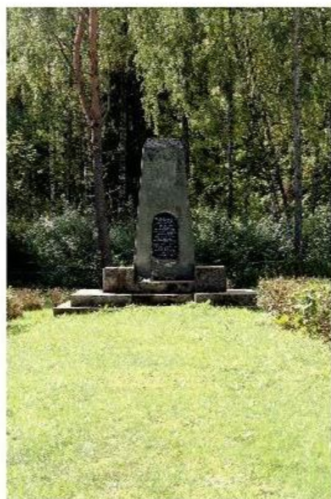
Holokausto vieta netoli Bajorų k.

1941 m. birželį, Lietuvą okupavus Vokietijos kariuomenei, prasidėjo nacių organizuotas žydų persekiojimas ir žudymas. 1941 m. liepos 27 d. pradėtos masinės žydų tautybės Lietuvos piliečių egzekucijos vyko iki 1941 m. rugpjūčio pabaigos. Rugpjūčio 15–16 d. netoli Rokiškio esančiame miške, prie Bajorų kaimo, buvo sušaudyta apie 3200 žydų. Rugpjūčio pabaigoje Antanašės kaime buvo nužudyta daugiau kaip 1000 žydų. Šiuo metu Rokiškyje negyvena nei vienas litvakų palikuonis.