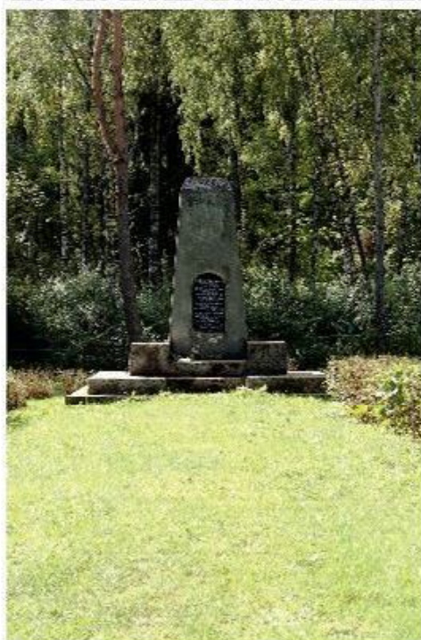
The place of Holocaust near Bajorai village.

In June of 1941, when Lithuania was occupied by German army, nazi organized persecution and killing of Jews had started. In 27 July 1941 massive executions of Jewish nationality Lithuanian citizens had started which lasted until the end of August 1941. During 15-16 of August in the forest, near Bajorai village, near Rokiškis were fusilladed about 3200 Jews. At the end of August in Antanašė village were killed more than 1000 Jews. At this moment in Rokiškis does not live no one from the descendants of litvakes.