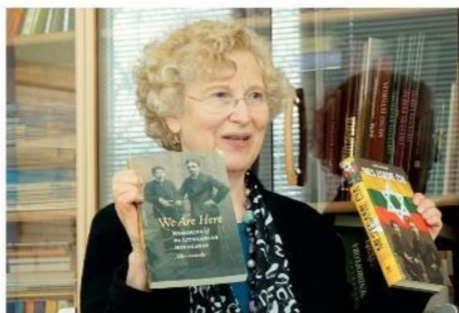
Rašytoja Ellen Cassedy pristatė savo knygą Rokiškio „Romuvos“ gimnazijoje 2012 m.