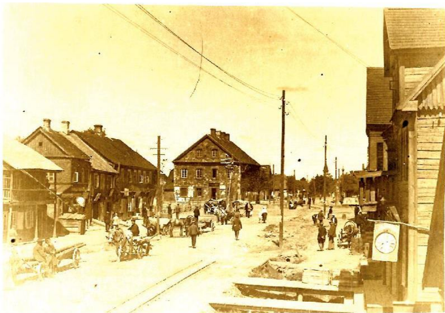
Rokiškis XX a. 3 deš. RKM 2296

Mulia pasakojo, kad jam labai patiko mokytis lietuviškoje mokykloje, nes turėjo laisvą laiką per tikybos pamokas. Žydų gimnazijos Rokiškyje nebuvo, tad daug žydų vaikų mokėsi lietuvių gimnazijoje. Gerbiant žydų religines tradicijas, mokytojai šeštadieniams neplanuodavo jokių rašto ir kontrolinių darbų bei leisdavo vaikams ateiti be portfelių. Broliai taip pat nejautė jokio antisemitizmo.