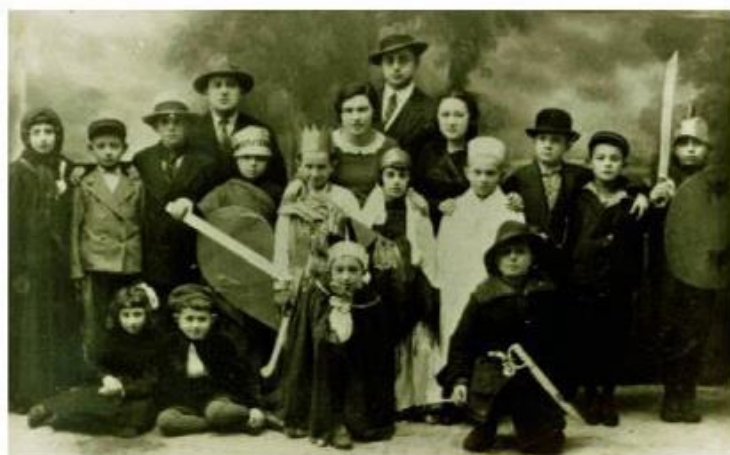
Moksleiviai pasipuošę Purimo šventei.