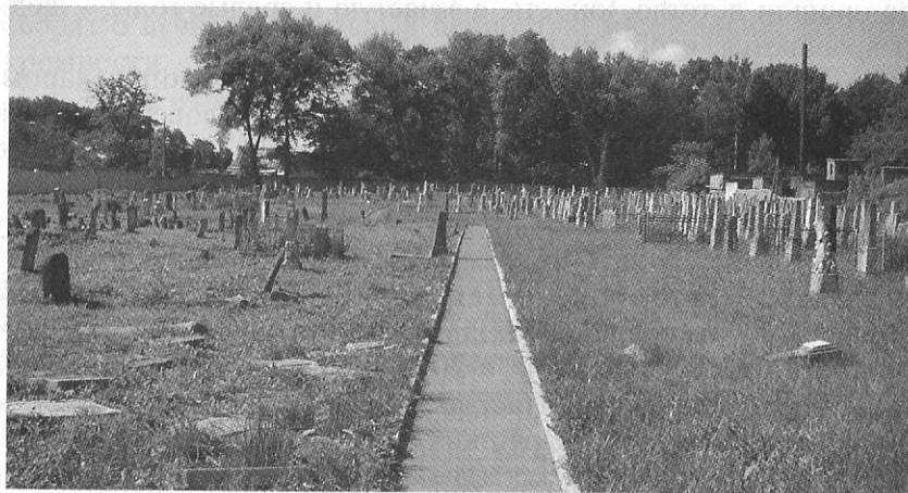
Историко-музейный комплекс "Свет души", 2005 год.