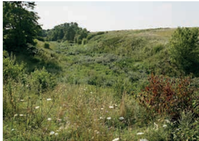
Yahad – In Unum, Paris France