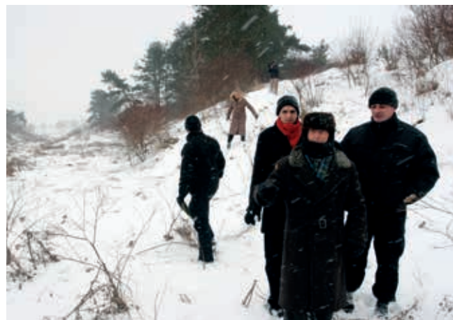
Yahad – In Unum, Paris France

Mizocz, January 2008: A Ukrainian eyewitness with members of Yahad – In Unum in the hollow. There are people taking videos in the background. Right: An eyewitness interviewed by Yahad – In Unum , being shown copies of Gustav Hille's photographs.